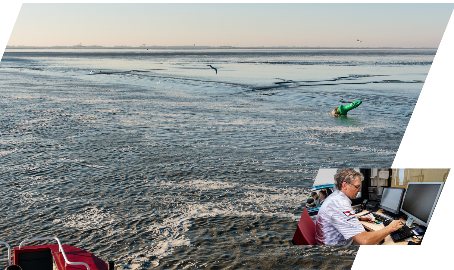
Aantallen passagiers naar de eilanden *

AT Osborne heeft in 2022 als onafhankelijk onderzoeksbureau in opdracht van I&W (concessieverlener) halverwege de lopende concessie een evaluatie uitgevoerd over de afgelopen 7 jaar. Naar aanleiding van dit onderzoek wordt bekeken of de huidige concessievoorwaarden nog voldoen (of dat hier veranderingen in aangebracht moeten worden) en worden de kaders opgesteld voor de nieuwe concessievoorwaarden na 2029. De resultaten van deze MTR zijn bij het schrijven van het Vervoerplan 2023 nog niet bekend, maar zullen zeker in 2023 en de jaren daarna van invloed zijn op hoe er naar processen wordt gekeken.